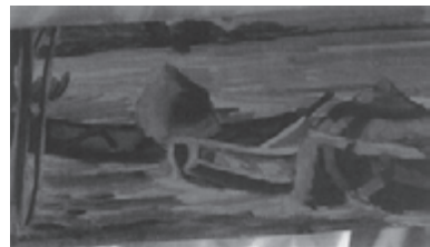
「木船のある海辺」 水彩

入場料 大人：800円 大学・高校生：600円 中学・小学生：400円 (団体割引、身障者割引あり)