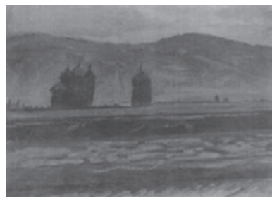
「サイロのある畑」 油彩